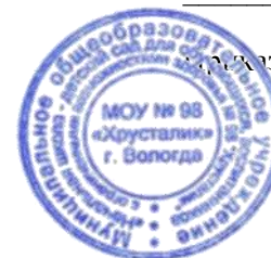
ГРАФИК ОЦЕНОЧНЫХ ПРОЦЕДУР на I полугодие 2022/2023 учебного года